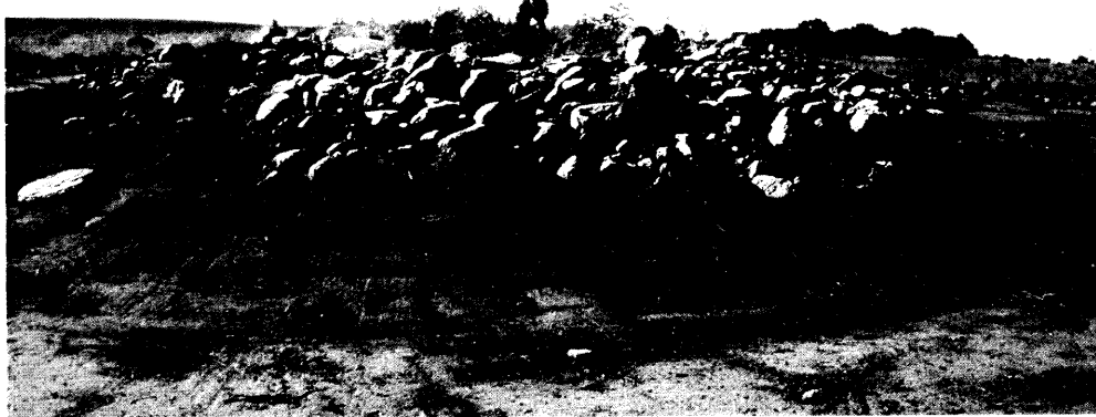
Abb. 41 Vermeintliches Hügelgrab von Schönfeld nach dem Entfernen des Bewuchses

ein 2 m hoher Steinhaufen mit einem Durchmesser von 12 m auf dem Acker dar (Abb. 41). Der Hügel war bis zum Frühjahr 2000 mit Holunder und kleineren Sträuchern bewachsen und wies fast mittig eine Kesselung auf.